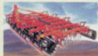
Attrezzo combinato per la preparazione del terreno Plano PL.

Per informazioni: Dante Macchine snc, Via E. Bandiera 12, Bagnoli di S. (Pd). Tel 049-5344011, fax 049-5344900. E-mail: dante.macchine@tiscalinet.it , internet: www.dantemacchine.it .