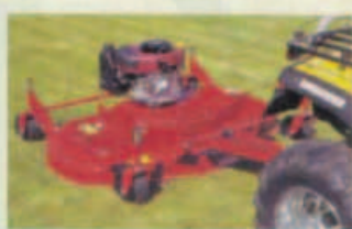
Le versioni standard Serie TC Special per ATV/QUAD montano motori Briggs Stratton da 11,5 CV.

re i distanziali montati sull'asse della forcella. Il timone di attacco è flottante per consentire alla macchina di seguire agevolmente le asperità del terreno. Inoltre, sono previste più posizioni per poter disossare la macchina rispetto al mezzo. I punti di ingrassaggio sono sette e facilmente raggiungibili. A tutto questo dobbiamo aggiungere che anche la tensione delle cinghie è semplice da controllare, perché ottenuta tramite la regolazione di un'unica vite posizionata dietro il motore. Le versioni standard Serie TC Special per ATV/QUAD montano motori Briggs & Stratton da 11,5 HP ma, su richiesta, sono disponibili anche altri modelli di motori delle